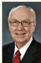
GEORGE O. WOOD, D.Th.P. je generální superintendent Assemblies of God, Springfield (Missouri, USA)

Tam, kde dochází k dynamickému zakládání sborů a růstu církve, funguje následujících deset principů: načasování, vzor, vyučování, tým, dřina, slzy, troud, ostn, transparentnost, nebezpečí.