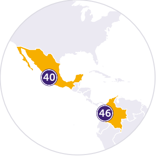
CENTRÁLNÍ A JIŽNÍ AMERIKA