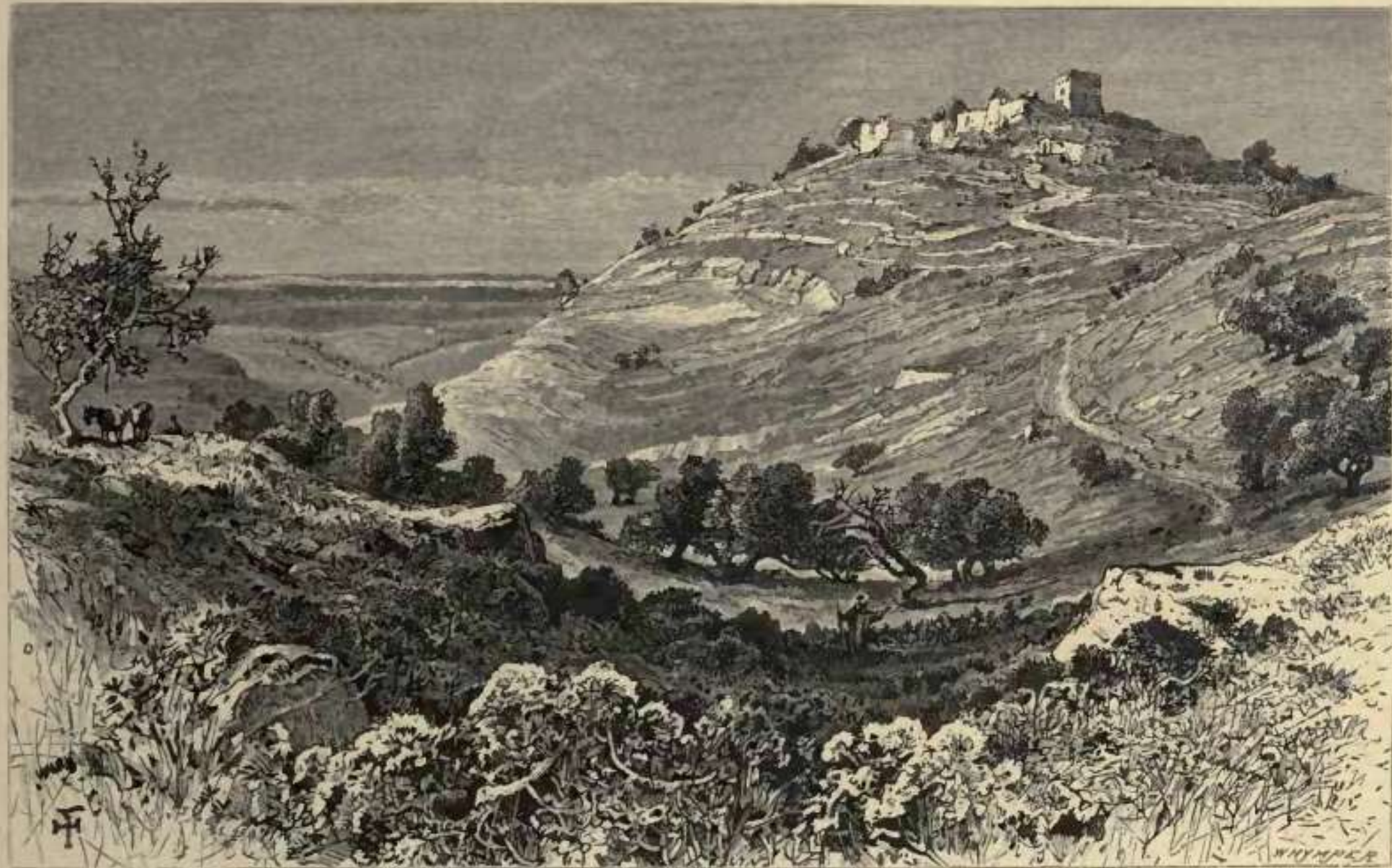
BEIT-'UR-EL-FOKA, ON THE SITE OF UPPER BETH-HORON.

In the distance the sandy line of coast and the Mediterranean Sea.